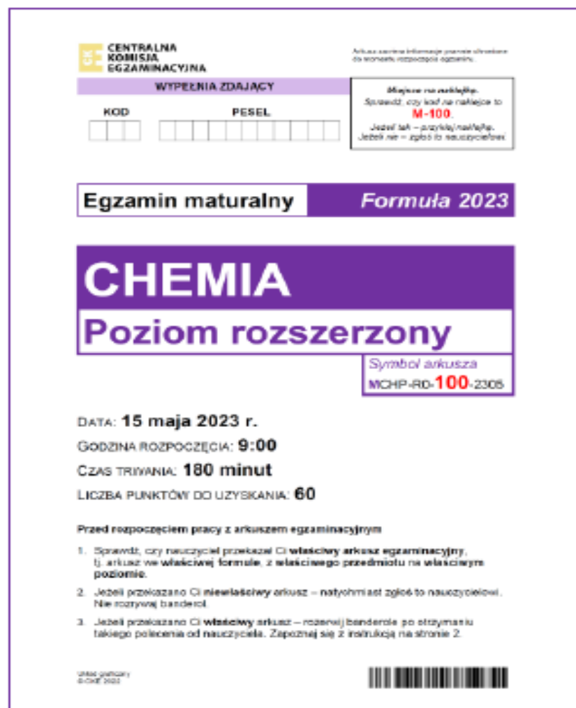
RYSUNEK 2A. Arkusz egzaminacyjny w Formule 2023 (strona tytułowa) – szata graficzna